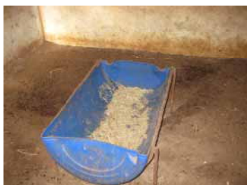
Figure 6 : Type de mangeoire en plastique

Les matériels identifiés sont entre autres, les mangeoires, les abreuvoirs, les râteliers, les pelles et les seaux. Ils sont généralement de fabrication artisanale locale. Les éleveurs préfèrent plus les abreuvoirs et mangeoires en plastiques que ceux en fer à cause de la rouille. Les mangeoires en plastiques servent en même temps d'abreuvoirs dans les élevages.