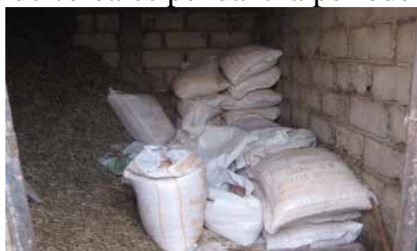
Figure 8: stock de fanes d'arachides et d'aliments concentrés

La stratégie des éleveurs pour réduire le coût de l'alimentation est de constituer des stocks de fourrage et de céréales pendant la période des récoltes.