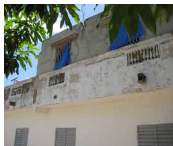
Figure 5 : Habitat des animaux au dernier étage de la maison

Presque tous les éleveurs enquêtés (94%) sont propriétaires des maisons, ce qui leur facilite l'aménagement d'un local pour l'habitat des animaux, seulement 6% des éleveurs déclarent être en situation de locataire, ce qui peut leur causer des difficultés d'effectuer des aménagements appropriés pour l'habitat des animaux.