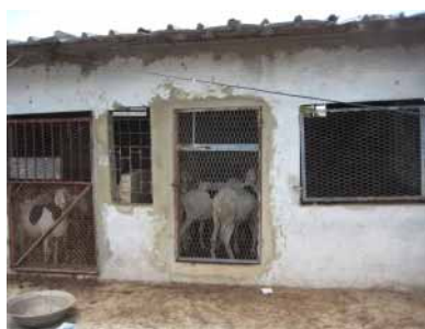
Figure 4 : Exemple d'habitat chez un éleveur

Un local de la concession de l'éleveur est transformé en habitat sous-forme de case ou de hangars en matériaux définitifs. Ces éleveurs créent toutes les conditions de sécurisation de leurs animaux car le vol de bétail est fréquent dans la zone.