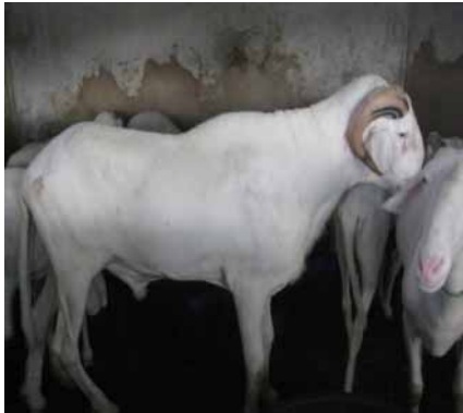
Figure 1 : Bélier de race Ladoum

Ladoum sont hypermétriques et longilignes avec une hauteur au garrot moyenne de 105\pm 3,56 cm chez le mâle et 88,8\pm 6,11 cm chez la femelle en considérant la classe d'âge de 19 à 24 mois. La longueur du corps est de 93,5\pm 2,08 cm pour le mâle et de 83,2\pm 8,07 cm pour la femelle (Sada, 2007). Les couleurs de robe dominantes sont la couleur blanche et la pie-noire, qui répondent plus aux critères de choix de mouton de Tabaski.