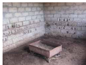
Figure 7 : Type de mangeoire en Fer