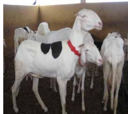
Figure 2 : Brebis de race Ladoum